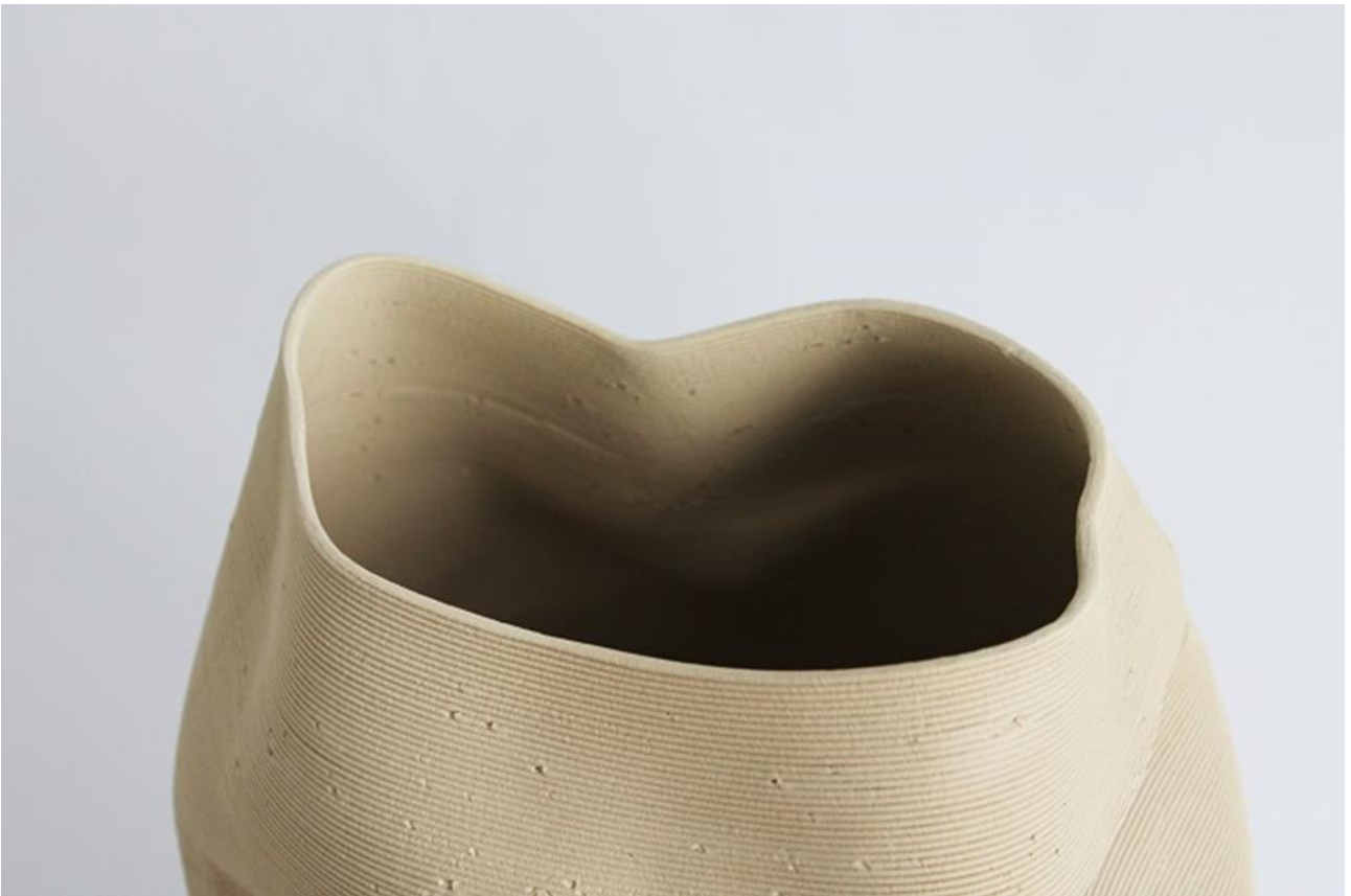
Boddenberg Helena_Earthen Fibres_detail