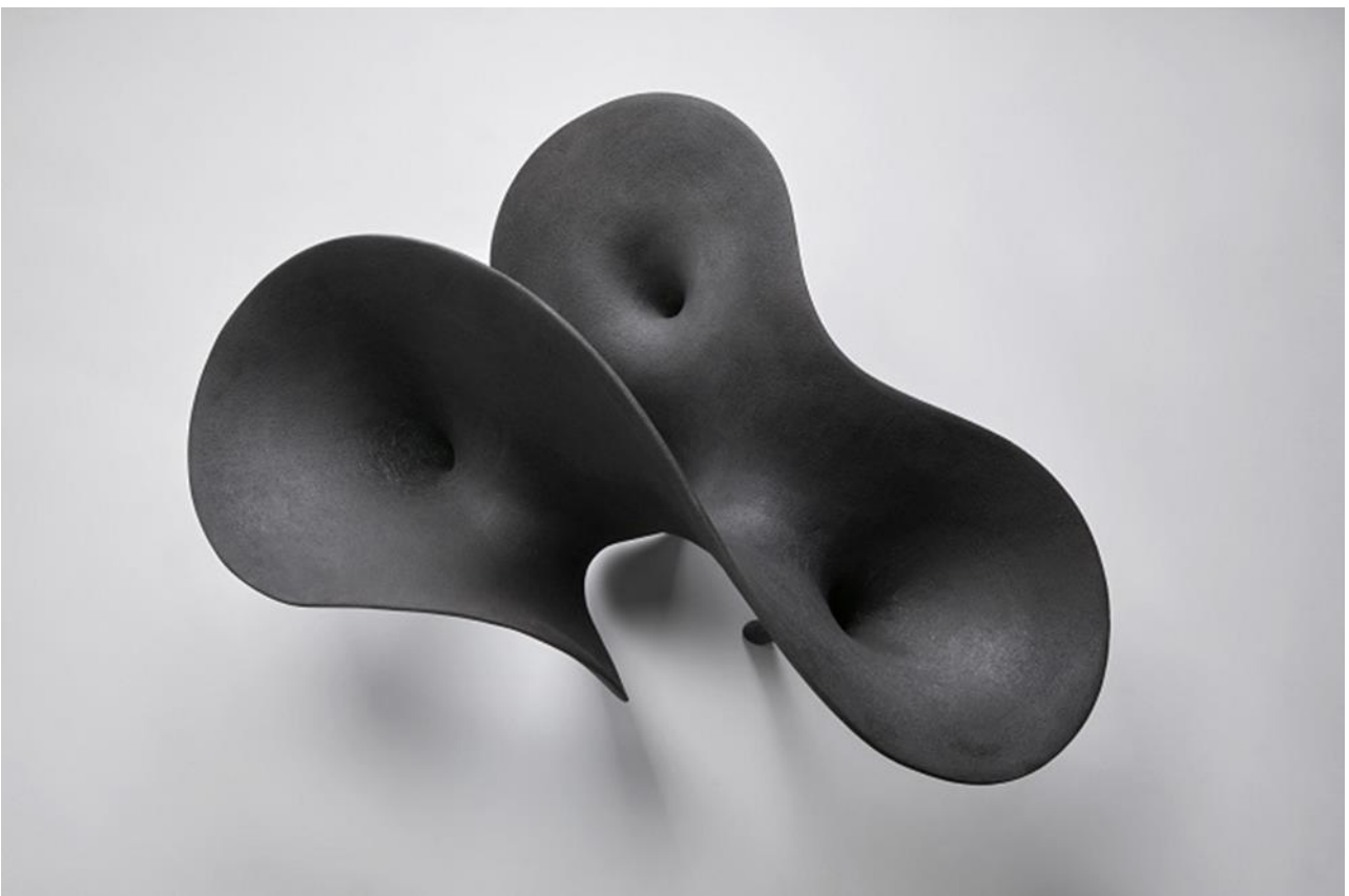
Kosma Iosifina_Blossoms of Thera